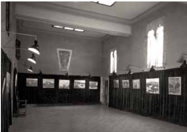
Sala d'exposicions del Museu de Mataró (1964).

Totes les aportacions s'incorporaran a l'exposició per anar completant el relat d'aquests anys i esperem que aquest material sigui la base per a futurs treballs que ens permetin aprofundir i donar a conèixer els fets més destacats d'aquesta època.