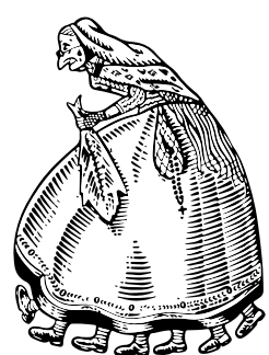
Confraria de les Set Setmanes

“Serra La Vella, un plat d'escudella; serra la Velló, un plat d'escudelló”