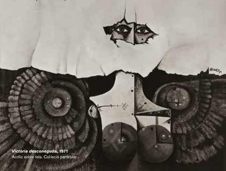
Victòria desconeguda, 1971