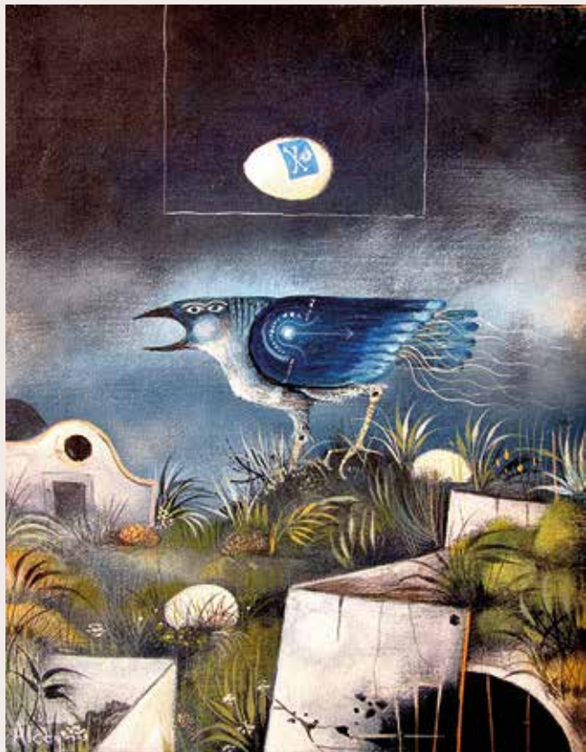
[Ocell blau], v. 1970 – 1971 Acrílic sobre tela. Col·lecció particular