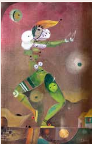
Acròbates dansaires, 1987. Oli sobre tela. Col·lecció particular