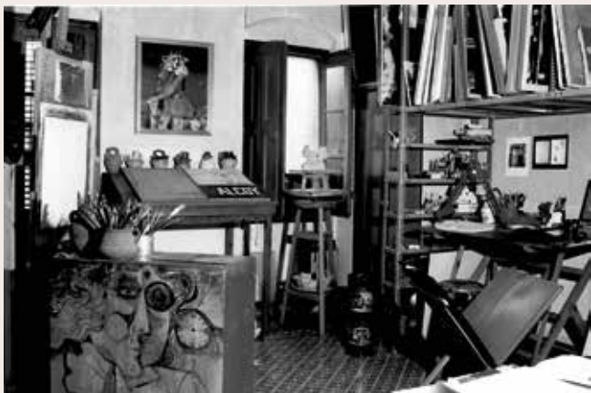
Estudi d'Eduard Alcay (1987).