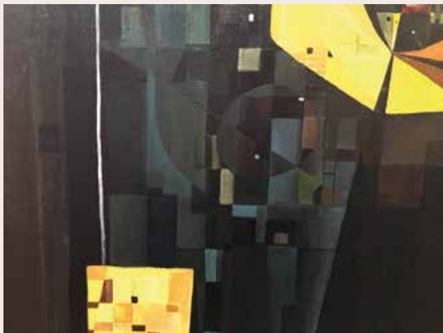
Detall Composició horitzontal o Yellow Dog Blues , 1955. Oli sobre tela. Col·lecció particular

Ja amb una perspectiva folgada, l'exposició incorpora aspectes centrals de l'obra d'Alcoy i altres de més ignorats o amagats, amb el desig de fer-los interactuar i contribuir a fer possible un millor coneixement de la seva aportació global.