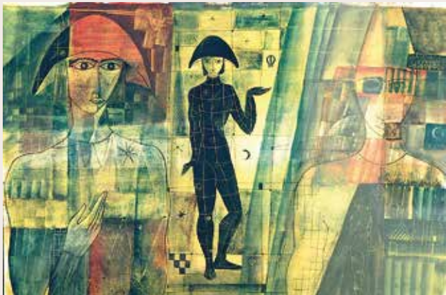
Arlequins, 1955. Cera sobre paper. Col·lecció particular