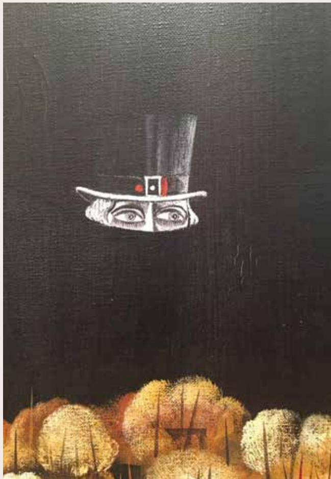
Detall de l'obra La Guerra , v. 1971 – 1972

Acrílic sobre tela. Col·lecció particular