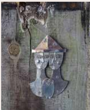
Joia de plata, 1972 Collecció particular