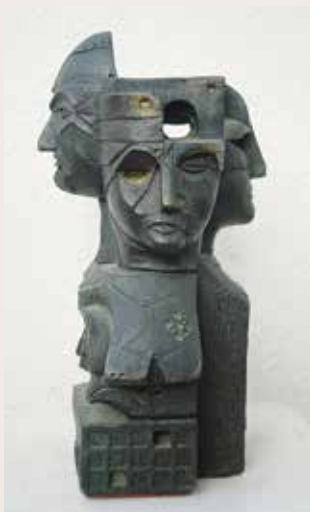
Torre de caps, v. 1970 – 1972 Bronze. Collecció particular