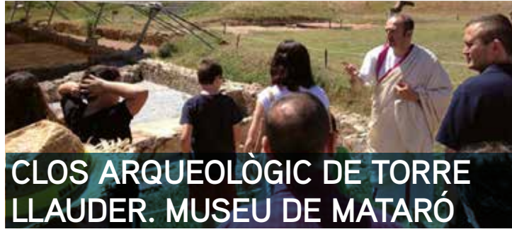
CLOS ARQUEOLÒGIC DE TORRE LLAUDER. MUSEU DE MATARÓ