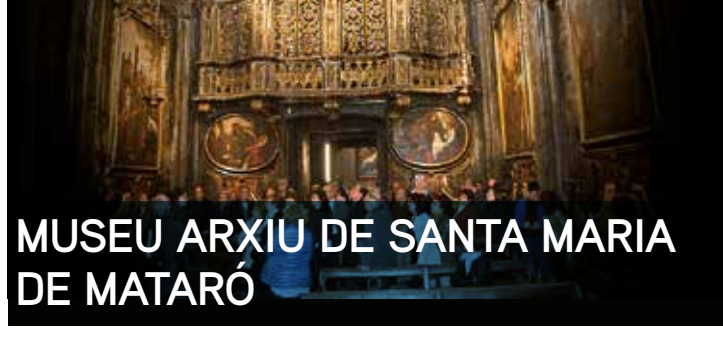
MUSEU ARXIU DE SANTA MARIA DE MATARÓ