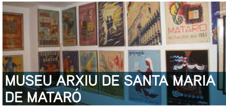
MUSEU ARXIU DE SANTA MARIA DE MATARÓ

11.30 h | Visita guiada. Àrea de reserva de les col·leccions tèxtils del Museu de Mataró La visita a aquest espai recentment obert al públic, dedicat a aprofundir sobre determinats aspectes de les col·leccions tèxtils, permetrà conèixer una interessant selecció de peces de la col·lecció d'indumentària dels anys 1960 al 1980, un període en el qual es va consolidar el consum de roba de punt per a vestir a la moda, tant adults com infants, d'estiu a hivern, per a ús diari, per fer esport, i fins i tot per a festes i cerimònies. Organitza: Direcció de Cultura de l'Ajuntament de Mataró - Museu de Mataró