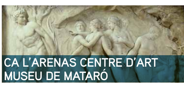
CA L'ARENAS CENTRE D'ART MUSEU DE MATARÓ