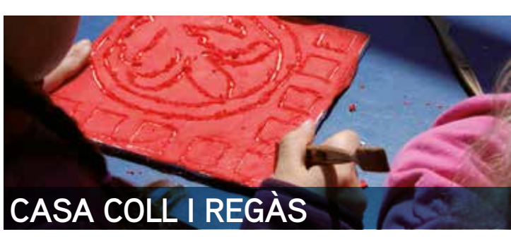
CASA COLL I REGÀS

12 h | Visita teatralitzada. Vil·la romana de Torre Llauder A cura de Jaume Ametller De la mà d'un personatge molt singular revelarem els secrets de la vil·la d'època imperial, residència d'un il·lustre patrici romà, i passejarem arreu per descobrir les dependències decorades amb esplèndids mosaics de colors, els banys i els dos peristils o patis. Activitat adreçada a tots els públics. En cas de pluja s'anul·larà l'activitat Organitza: Direcció de Cultura de l'Ajuntament de Mataró - Museu de Mataró