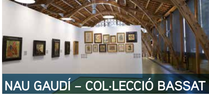
NAU GAUDÍ - COL·LECCIÓ BASSAT