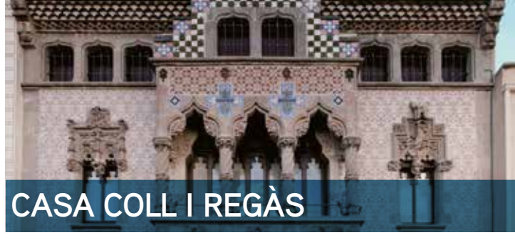
CASA COLL I REGÀS

De 18 a 20 h | Portes obertes. La capella dels Dolors i la sala de juntes. Muntanyes del barroc català en estat pur Dolors i la sala de juntes. Començades abans de la Guerra de Successió i finalitzades dues dècades després, custodien un extraordinari conjunt pictòric sorgit del taller d'Antoni Viladomat (1678-1755) i del barroc íntegrament. Els elements escenogràfics i el dramatismes del Barroc, a la capella; la glòria i l'emotivitat, a la sala de juntes, "la capella Sixtina de Mataró". Organitza: Museu Arxiu de Santa Maria de Mataró