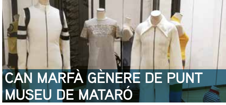
CAN MARFÀ GÈNERE DE PUNT MUSEU DE MATARÓ

11.30 h | Visita guiada. Àrea de reserva de les col·leccions tèxtils del Museu de Mataró La visita a aquest espai recentment obert al públic, dedicat a aprofundir sobre determinats aspectes de les col·leccions tèxtils, permetrà conèixer una interessant selecció de peces de la col·lecció d'indumentària dels anys 1960 al 1980, un període en el qual es va consolidar el consum de roba de punt per a vestir a la moda, tant adults com infants, d'estiu a hivern, per a ús diari, per fer esport, i fins i tot per a festes i cerimònies. Organitza: Direcció de Cultura de l'Ajuntament de Mataró - Museu de Mataró